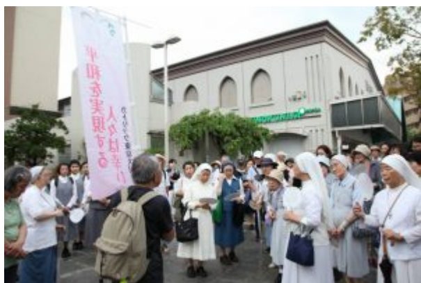
JR目白駅前からカテドラルまで平和巡礼ウォーク