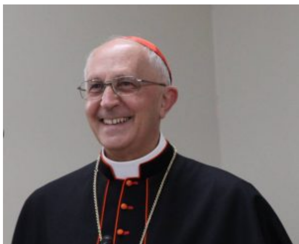
教皇庁福音宣教省長官フェルナンド・フィローニ