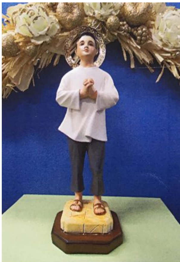
St. Lorenzo Ruiz de Manila

日本の聖人の記念日といえばもう一つ、9月28日に「聖トマス西と15殉教者」という記念日があります。こちらは江戸時代に入っ てからの殉教者ですが、この記念日は日本以外では「聖ロレンソ・ルイスと同志殉 教者」という名前で知られているそうです。